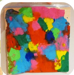
フィンガーペイント